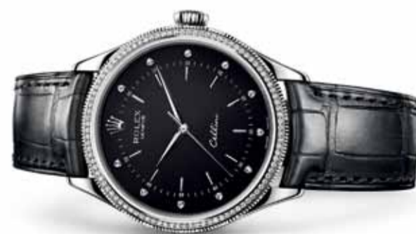
CELLINI TIME IN 18 CT WHITE GOLD

ΑΥΤΟ ΤΟ ΡΟΛΟΙ ΕΧΕΙ ΖΗΣΕΙ ΜΟΥΣΙΚΗ ΠΟΥ ΣΥΓΚΙΝΕΙ ΚΑΙ ΠΑΡΑΔΟΣΗ ΑΝΑΛΛΟΙΩΤΗ ΣΤΟ ΧΡΟΝΟ.